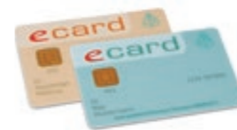
Ärzte- und Patienten-e-card

Mehr Infos über das beste Kommunikationspaket gibt es bei Ihrem persönlichen Betreuer, beim A1 Service Team unter 0800 664 828 oder unter gesundheit@a1telekom.at und auf A1.net/business